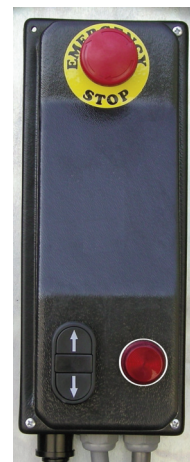
Notausschalter an jeder Säule