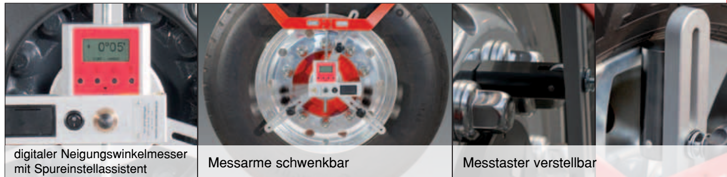
digitaler Neigungswinkelmesser mit Spureinstellassistent